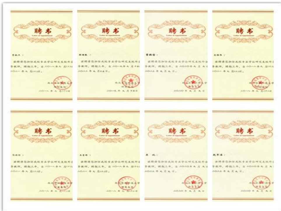
图 1 校外合作导师聘书（部分）